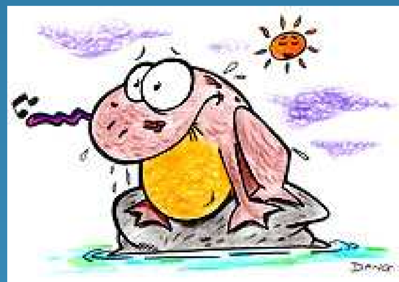
Si : 1,31 W/cm.K

Comparaison du comportement à hautes températures ( 200\text{ }^\circ\text{C} ) du Silicium et du Diamant (en italique la conductivité thermique)