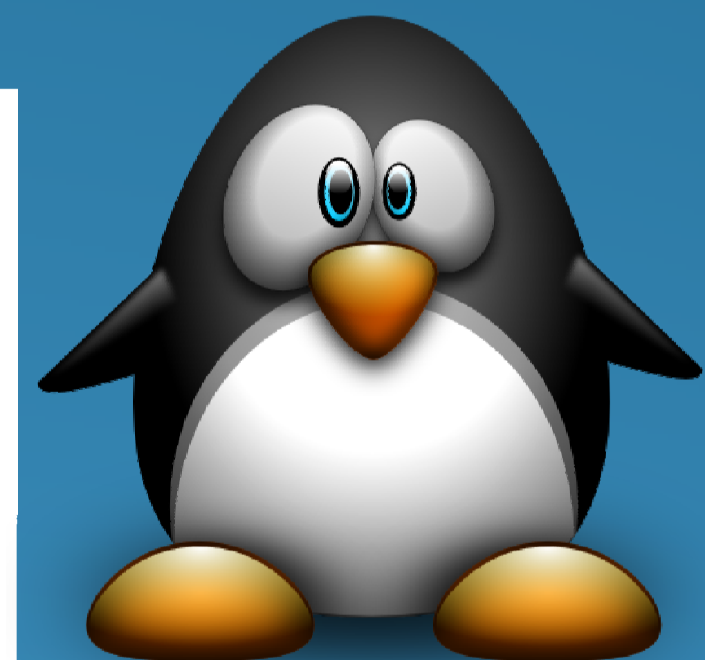
Diamant : 22 W/cm.K

Comparaison des champs de rupture du Silicium et du Diamant