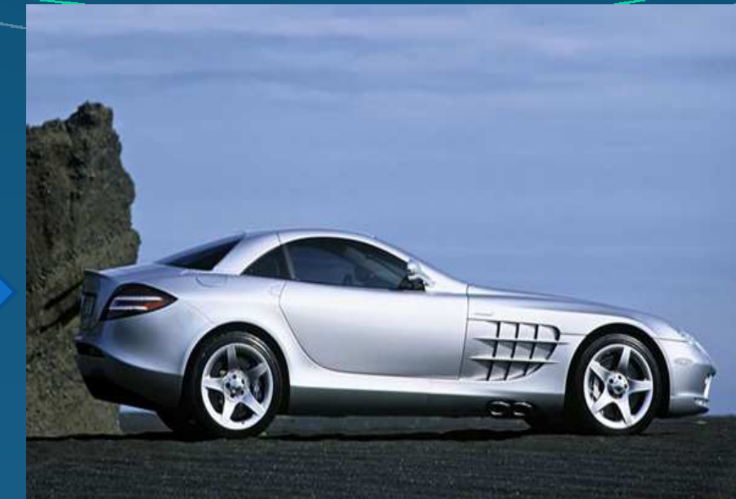
Carbure de Silicium-4H