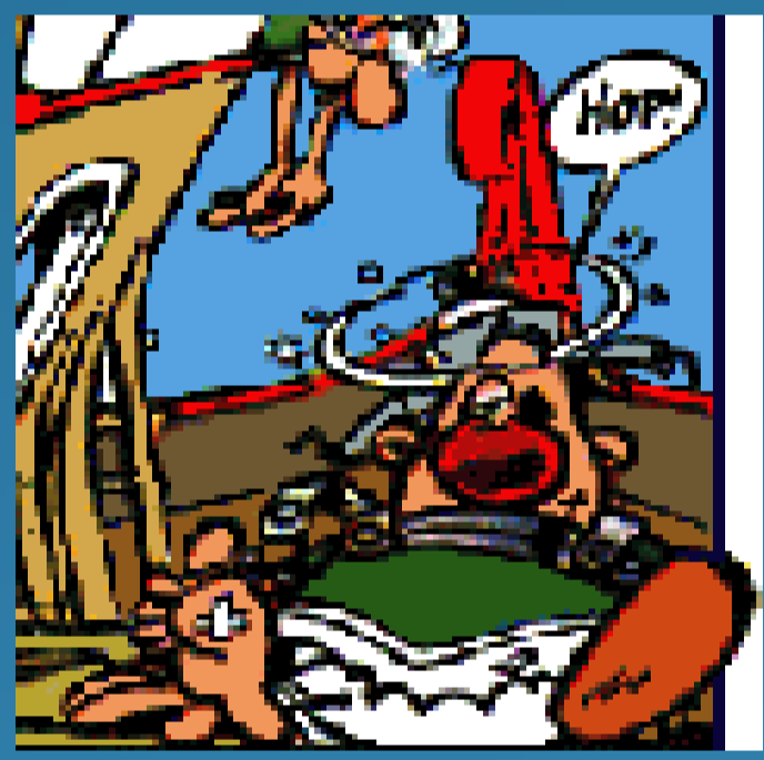
Si : 1,1eV

Comparaison des largeurs de bande interdites du Silicium, du Carbure de Silicium et du Diamant