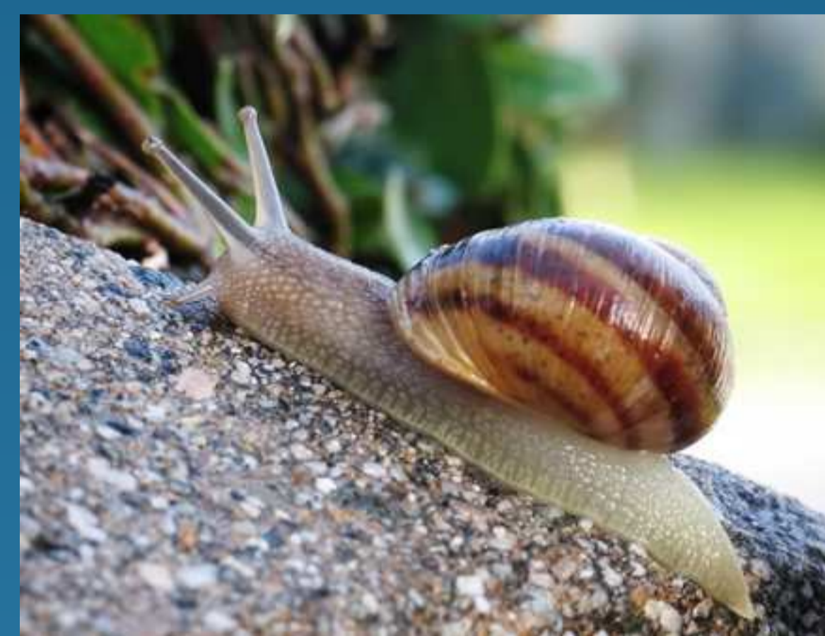
Si : quelques centaines de kHz

Comparaison des fréquences d'utilisation du Silicium et du Diamant