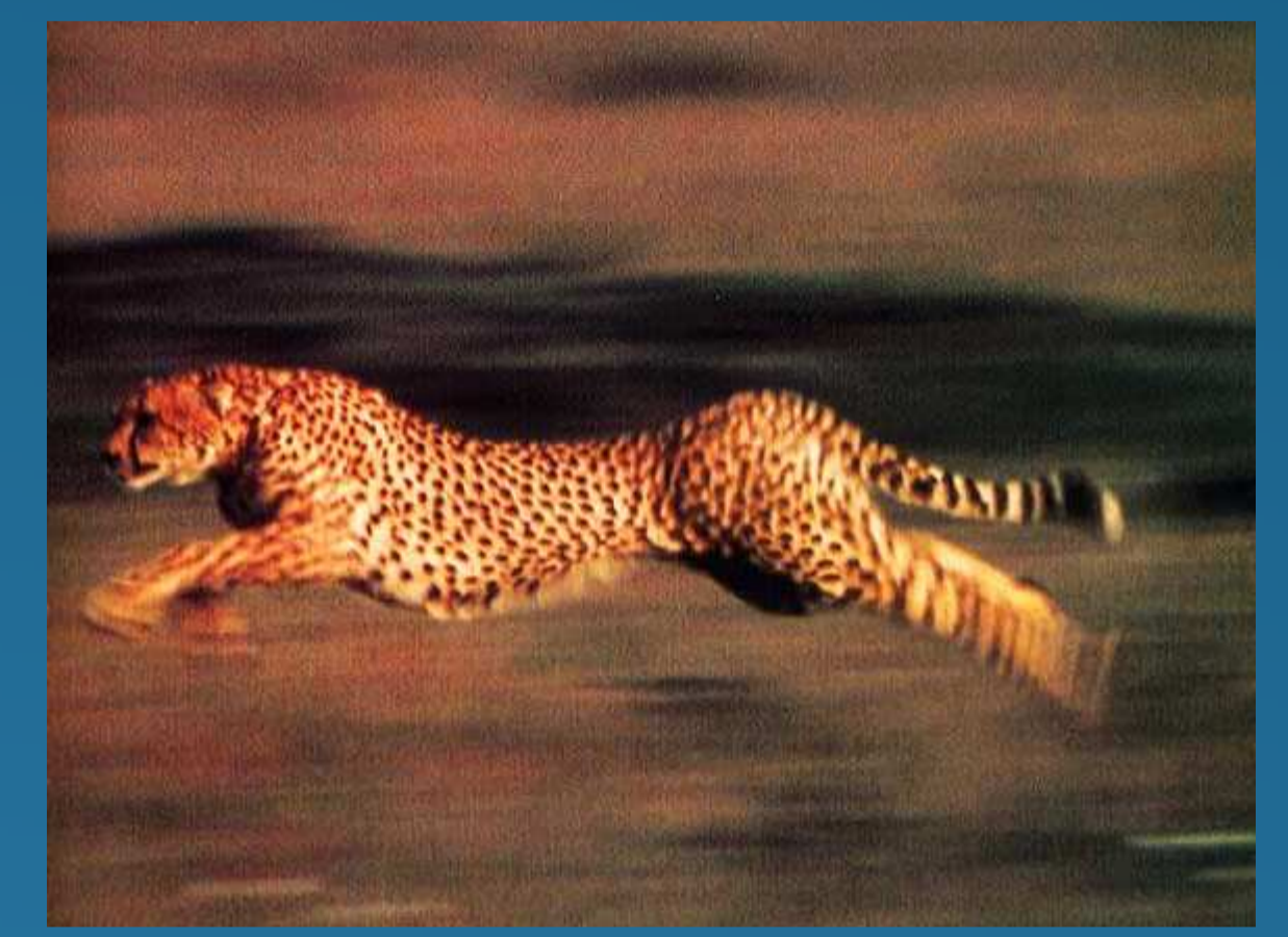
Diamant : quelques centaines de MHz

Comparaison des largeurs de bande interdites du Silicium, du Carbure de Silicium et du Diamant