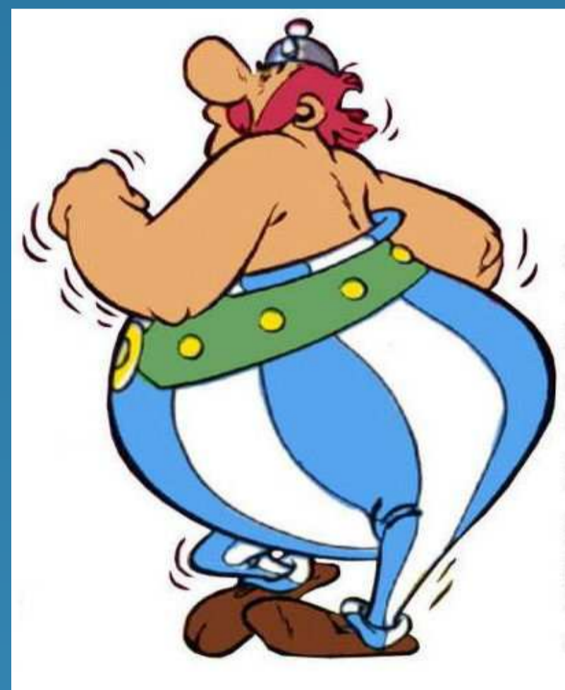
Diamant : 5,5eV

Comparaison du comportement à hautes températures ( 200\text{ }^\circ\text{C} ) du Silicium et du Diamant (en italique la conductivité thermique)