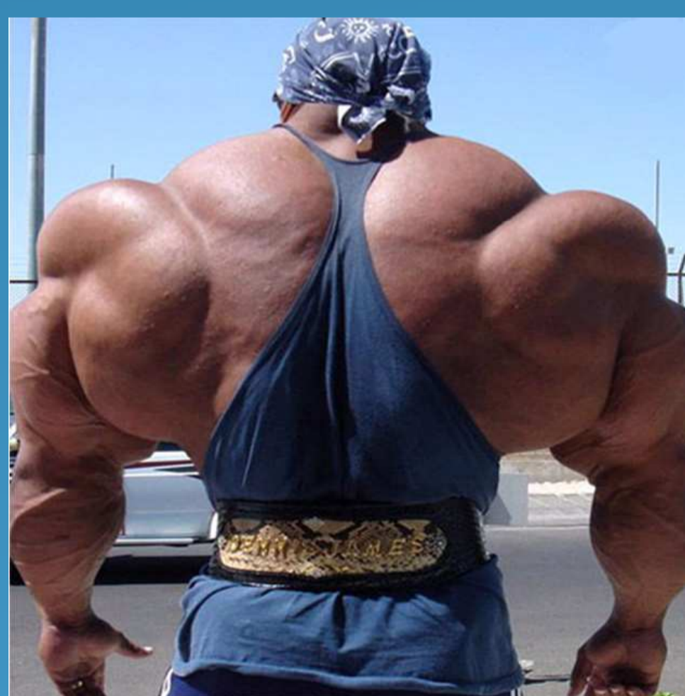
Diamant : 10^7 V.cm^{-1}

Pour l'instant, différentes équipes ont obtenu des résultats très prometteurs, quelques exemples sont donnés ci-après :