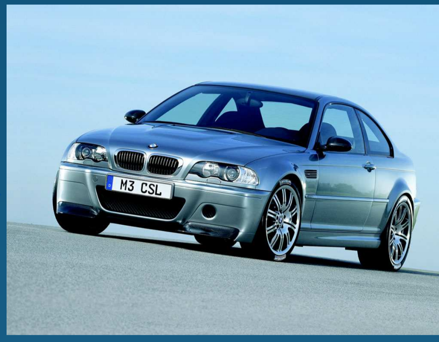
Arséniure de Gallium