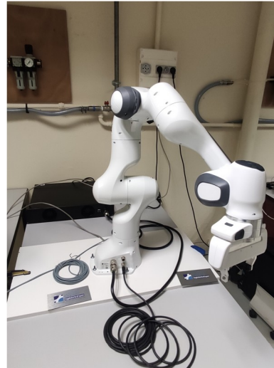
Robot Franka Emika

Robot 'Robo Cylinder' SCARA 3 ddl, répétabilité 0.02 mm, contrôle en vitesse ou en couple, longueur de course de 50 mm à 1000 mm, vitesse de 1 mm/s à 1000 mm/s.